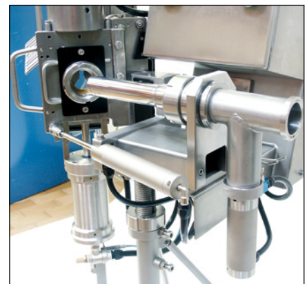
Bomba aspirante de retorno