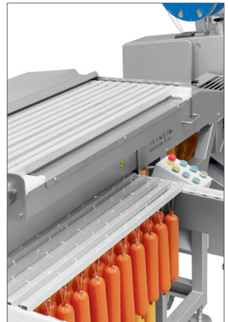
Almacén de plantas de ahumado accionado por motor para alojar 22 plantas de ahumado.

El sistema completo de un solo fabricante, – SwiStick, clipeadora doble, clips, lazos y etiqueta – es garantía de una producción impecable y más segura. La aleación, el perfil y la precisión dimensional de los clips TIPPER TIE representan factores esenciales que los convierten en estándar industrial para la elaboración de envases seguros. Los productos se pueden dotar de un etiquetado individual con diversos tipos de marcajes. Los clips o lazos de